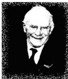
Stanley Morison (1889–1967)

Stanley Morison, Letter Forms — Typographic and Scriptorial: Two Essays on Their Classification, History and Bibliography , Hartley & Marks, Vancouver, Canada 1997. Σελ. 128. ISBN 0-88179-136-9. Τιμή 19,95 δολ. ΗΠΑ (περίπου 25 €). Διατίθεται από βιβλιοπωλεία ξενόγλωσσων έπιστημονικών βιβλίων.