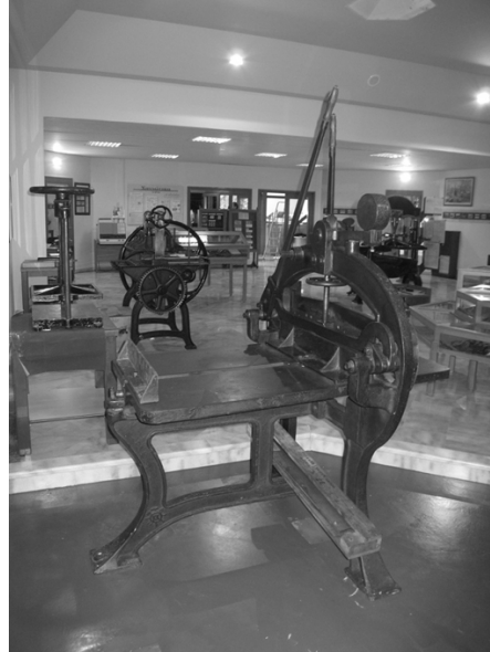
Άποψη του Μουσείου Τυπογραφίας. Σε πρώτο πλάνο κοπτική μηχανή του 1870.

σε μια γωνιά, να απομαγνητοφωνώ ειδήσεις — τότε βλέπετε δεν υπήρχαν πρακτορεία, διαδίκτυο κ.λπ. — να κάνω διορθώσεις.