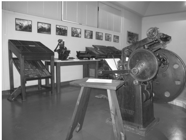
Μουσείο Τυπογραφίας: Ποδοκίνητο πιεστήριο του 1895. Στο βάθος, κάσες ταξινόμησης μεταλλικών στοιχείων.