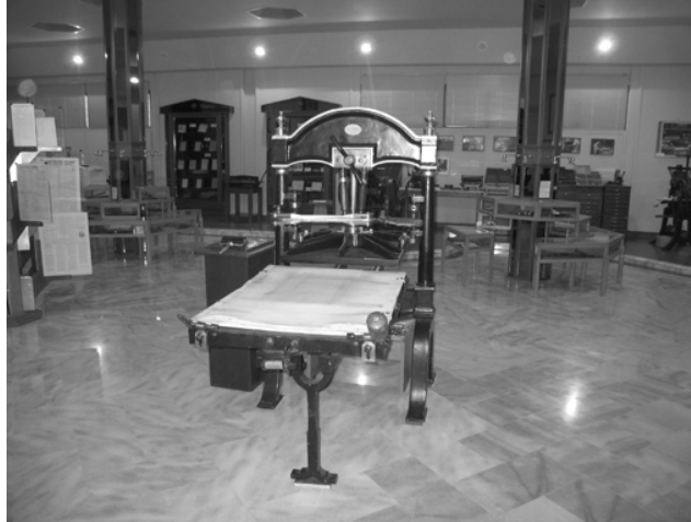
Μουσείο Τυπογραφίας: Χειροκίνητο τυπογραφικό πιεστήριο του 1835. Μοντέλο Hagar Krause γερμανικής κατασκευής.

Τυπογραφίας άρχισε να στριφογυρίζει από τότε, πριν τρεις δεκαετίες, περίπου, στο μυαλό μου.